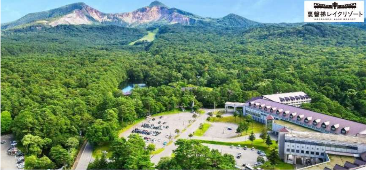
裏磐梯レイクリゾート URABANDAI LAKE RESORT