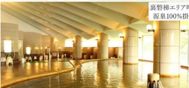
裏磐梯エリア唯一の自噴式 源泉100%掛け流し温泉