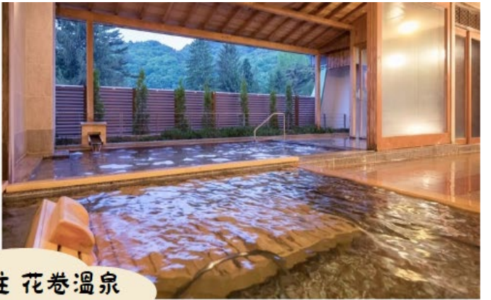
保證入住 花巻温泉 或 百選温泉紫苑