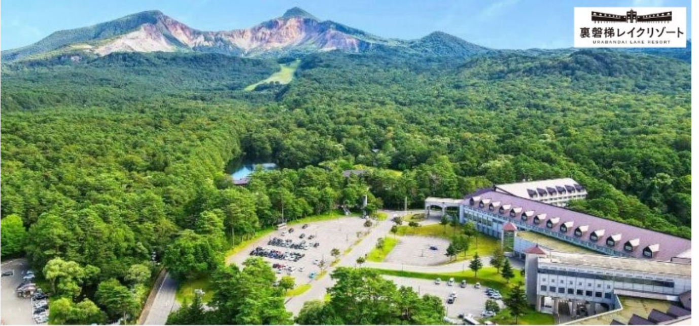
裏磐梯エリア唯一の自噴式 源泉100%掛け流し温泉