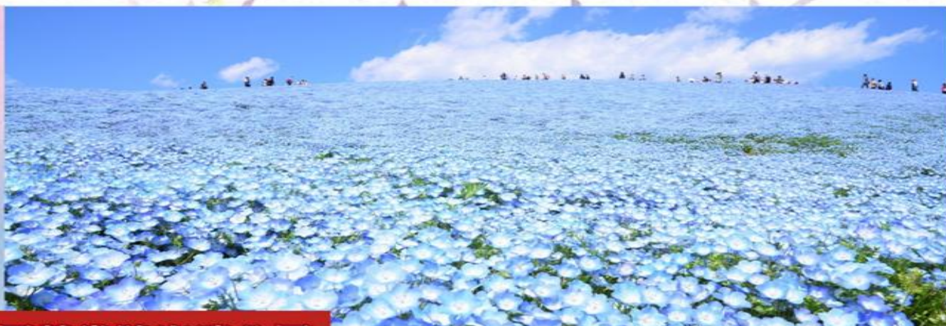
國營常陸海濱公園

台灣遊客較少前往的茨城縣有個賞花名所，推薦喜愛日本旅行、花卉攝影的旅人前往，那就是花卉種類豐富、視野遼闊的國營日立海濱公園，顧名思義其地理位置鄰近海洋太平洋，在欣賞植物花草之際，也能遠眺海景，讓景致更加有層次，宛如置身仙境般浪漫夢幻！