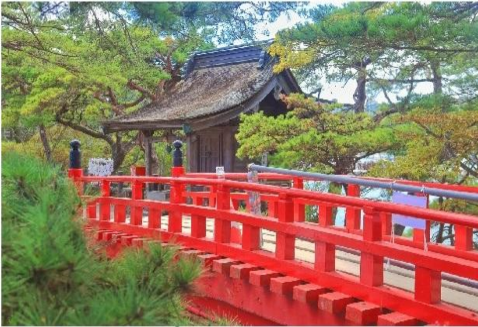
松島象徵的建築—松島五大堂

在東北地區具有千年的歷史，木造屋頂為單層造形，透露出歷史的刻痕，現成為日本重要文化財，並列為文化保護材，五大堂這座吸引了眾多遊客的建築物位於五大堂島上。它是政宗於1609年再建的。五大明王像被供奉在堂中。五大堂的五字即由此而來。五大堂內的頂部繪有中國的十二生肖之像。這裡只在每三十三年舉行一次的特殊儀式時才向公眾開放。