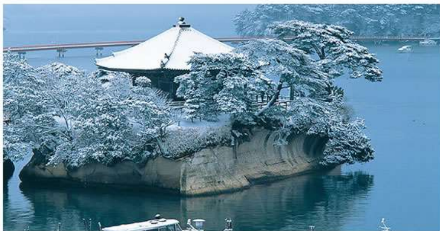
松島象徵的建築——松島五大堂

在東北地區具有千年的歷史，木造屋頂為單層造形，透露出歷史的刻痕，現成為日本重要文化財，並列為文化保護材。五大堂這座吸引了眾多遊客的建築物位於五大堂島上。它是政宗於 1609 年再建的。五大明王像被供奉在堂中。五大堂的五字即由此而來。五大堂內的頂部繪有中國的十二生肖之像。這裡只在每三十三年舉行一次的特殊儀式時才向公眾開放。