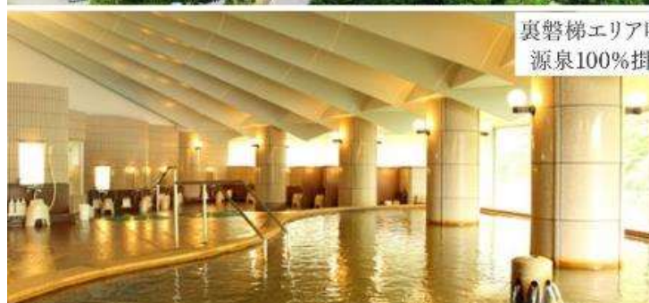
裏磐梯エリア唯一の自噴式 源泉100%掛け流し温泉