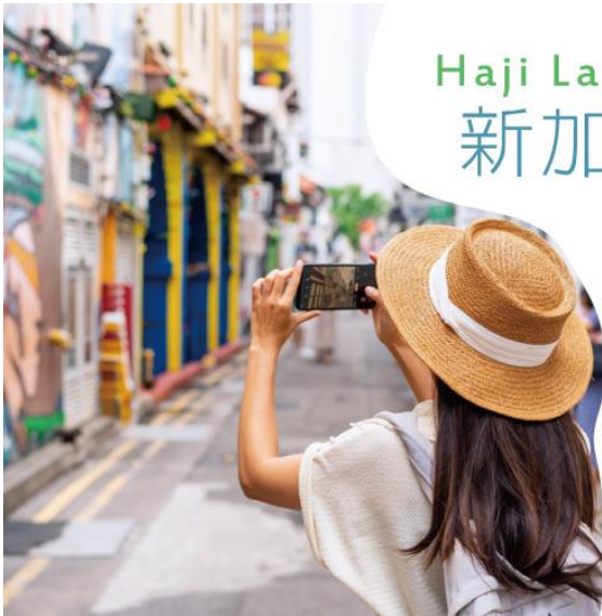
Haji Lane 新加坡