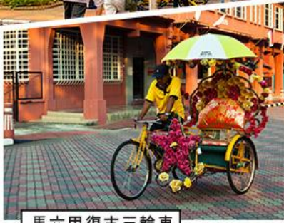
馬六甲復古三輪車