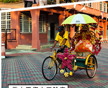
馬六甲復古三輪車