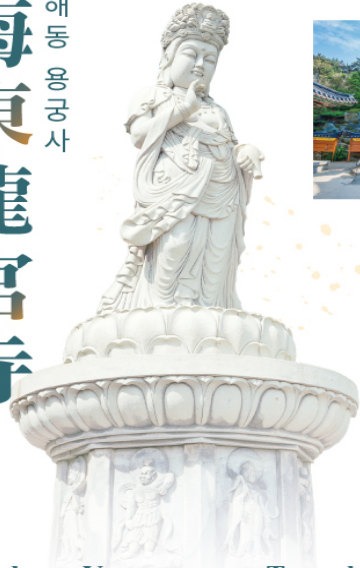
Haedong Yonggungsa Temple