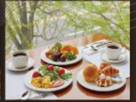
Lotte Hotel Ulsan