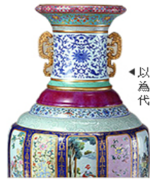
◀以明清皇室舊藏文物為基礎，堪稱中國古代藝術品的寶庫。