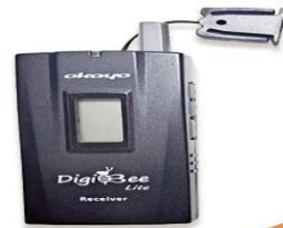
全程專業導覽耳機

本行程所附之語音導覽器為租借使用,如 因旅客個人因素遺失或損壞,依廠商規定 需賠償每台機器NT$2000,特此說明。