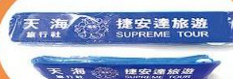
行李束帶一條 (顏色隨機)