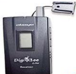
全程專業導覽耳機

本行程所附之語音導覽器為租借使用，如因旅客個人因素遺失或損壞，依廠商規定需賠供每台機器NT$2000，特此說明。