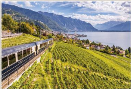
黃金列車 Golden Pass Line